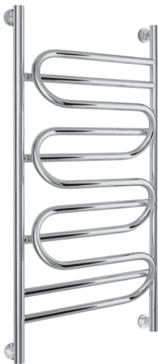
Рис. 1 Модель «Иллюзия+»

1.2. Конструктивно радиатор изготавливается различных моделей и типоразмеров (рис. 1).